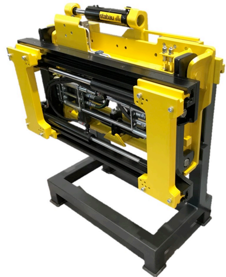
Stabau Schnellwechsellvorrichtung SCHWV OQ mit separatem Seitenschub in Kombination mit einer Zinkenverstellung ZVP